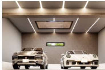
ガレージ(イメージ)