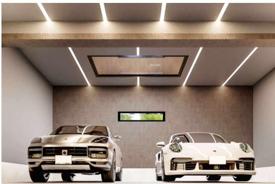
ガレージ(イメージ)