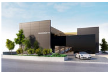
プライベートガレージ付き高級賃貸住宅 「LEGISENSE-TH」誕生